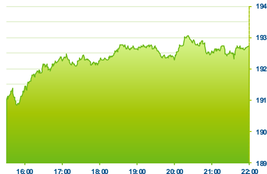
S&P 500 (předchozí den)

kukuřici (+1,0%), pšenici (+1,2%) nebo již zmiňované mědi (+0,7%).